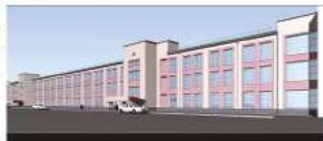
Новая маркетинговая политика ОАО «ЧТП» – организация Бизнес Центра «Теплоприбор»