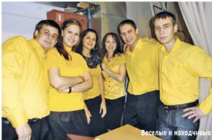
Веселые и находчивые