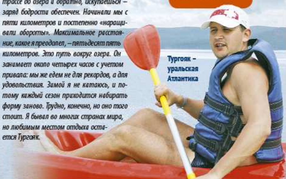
Тургояк — уральская Атлантика

В 2010 году руководящий состав «Теплоприбора» пополнился двумя новыми сотрудниками. На данный момент эти люди должным образом проявили себя в работе, а вот как они предпочитают проводить редкие минуты досуга? Праздничный выпуск рубрики «Наши люди» приоткрывает завесу тайны.