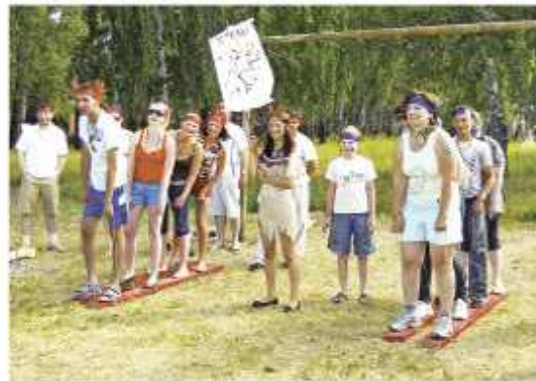
Индийские игры на Дне молодежи

Прошедший год в очередной раз показал, как интересна и насыщена корпоративная жизнь Группы предприятий