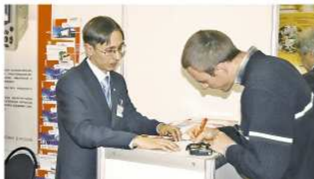
Выставка «Нефтедобыча. Нефтепереработка. Химия», г. Самара, октябрь 2010 г.