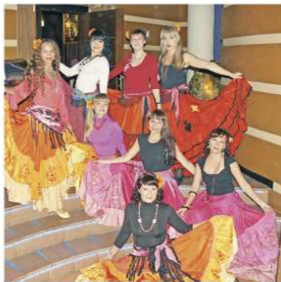
Настоящие цыганки должны иметь экономическое образование