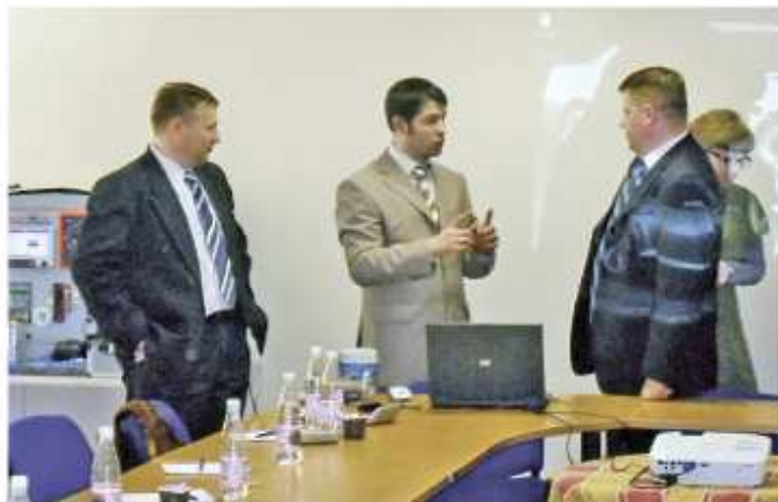
Семинар для Заказчиков Уральского региона, г. Ревда, апрель 2010 г.