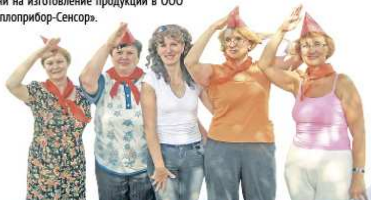
Сотрудники СУПера: трудиться на благо родного предприятия всегда готовы!