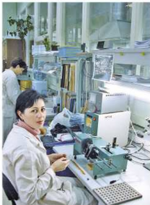
Участок ЭМЧ: принципы 5S в действии