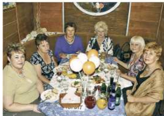
С Днем Машиностроителя!