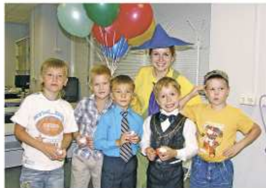
Незнайка и будущие первокурсники